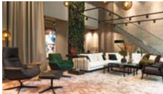
JAB ANSTOETZ GROUP Unterer Anger 3, 80331 München