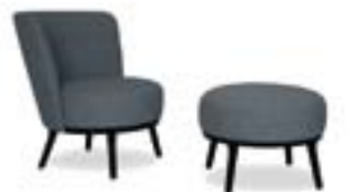
Polo Cocktail Sessel / Polo Cocktail chair