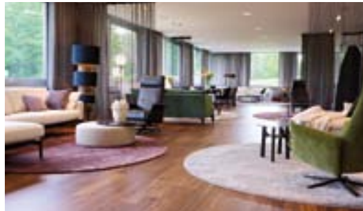
BW BIELEFELDER WERKSTÄTTEN Potsdamer Straße 180, 33719 Bielefeld

Besuchen Sie uns in unseren Showrooms: Come visit our showrooms