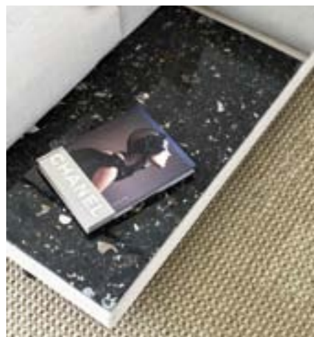
Tischelement Terrazzo / table element terrazzo

As practical accessories, LONG ISLAND offers table elements made of exciting materials coordinated to the COMPLEMENTS series table models that can be used in many different ways – as a finishing element or intermediate addition in seating combinations, or as a classic side table. The tall edge that acts like a tray to catch a spilled drink, is a particularly clever touch.