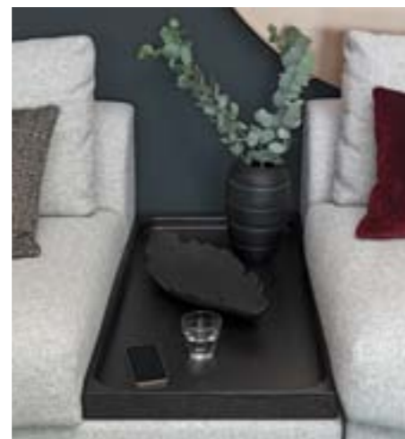
Tischelement Esche / table element ash