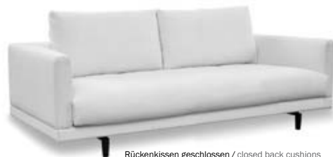
Rückenkissen geschlossen / closed back cushions Sitzkissen einteilig / one-piece seat cushions