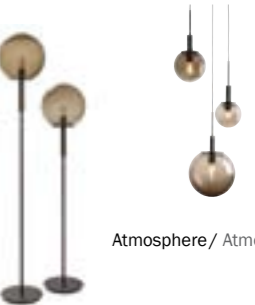
Atmosphere / Atmosphere