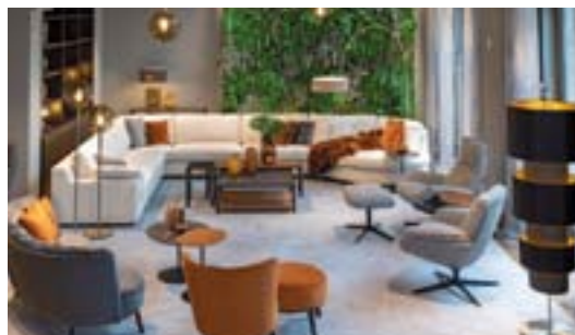
JAB ANSTOETZ GROUP Knesebeckstraße 61, 10719 Berlin