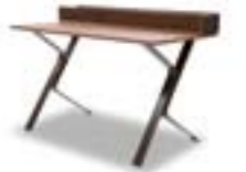
Supreme / Supreme