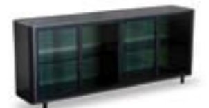
Allure / Allure