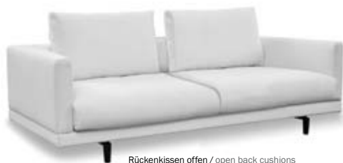
Rückenkissen offen / open back cushions Sitzkissen geteilt / divided seat cushions

Because every person is different, LONG ISLAND offers two variants of seat cushions as well: as a one-piece surface area, or separate individual areas. The two backrest options offer even more design freedom. Customers can choose between open and closed cushions.