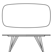
2750 B 210 T 104 H 75